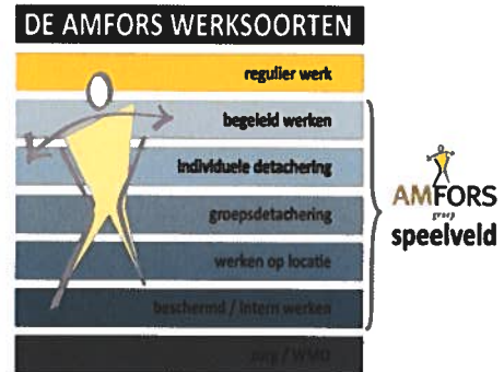
Figuur 1: Werksoorten

Arbeidsinventarisatie en -ontwikkeling – De focus van Amfors ligt voornamelijk op het realiseren en behouden van een duurzame arbeidsplek voor de Sw-medewerkers. Amfors voert hiervoor ontwikkelgesprekken met de medewerkers. Deze ontwikkelgesprekken geven inzicht in de individuele mogelijkheden en beperkingen met als doel de medewerkers een zo passend mogelijke duurzame werkplek te bieden. Amfors biedt daarbij diverse opleidingen en trainingen zoals: Werk je fit, Fluitend naar je werk, Omgaan met Geld. Ook op het gebied van taalvaardigheid geeft Amfors met regelmaat cursussen Nederlandse taal. Daarnaast volgen diverse medewerkers de verplichte opleidingen in het kader van veiligheid.