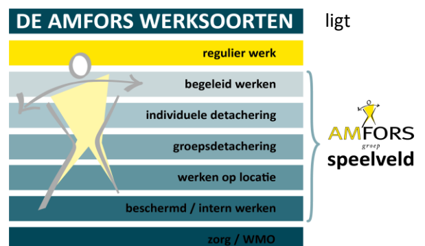
figuur 1: Werksoorten

Mobiliteit – De realisatie van de verdeling in werksoorten in 2022 in lijn met de verwachte verdeling zoals die in de begroting over datzelfde jaar is opgenomen. De focus ligt inmiddels meer op het realiseren en behouden van een passende duurzame arbeidsplek waar rekening is gehouden met de mogelijkheden en beperkingen van de betreffende Sw-medewerker. Ultimo 2022 tellen we 712 SE (arbeidsjaren voor Sw-ers) tegenover 773 SE in 2020. Een krimp van meer dan 7%.